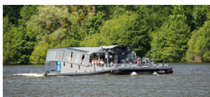
L'Erdre et ses châteaux