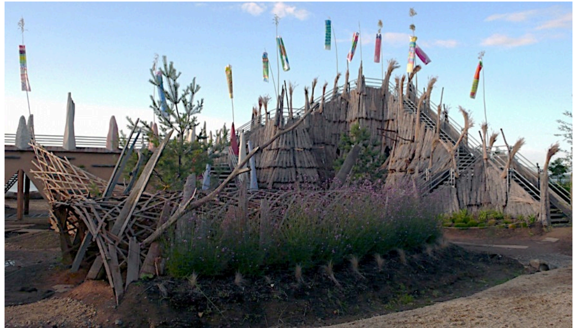
Le Dragon bleu, gardien de l'Est